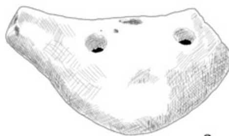
Рис. 5 Свистулька по форме и типу похожа на свистульку, найденную в Апонитищенских курганах в XIX в.