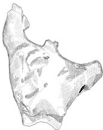
Рис. 4. Ангобированная свистулька с четырьмя отверстиями на тулове внутри полой поверхности сохранился также камушек.