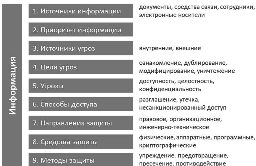
Рис. 1. Концептуальная модель информационной безопасности